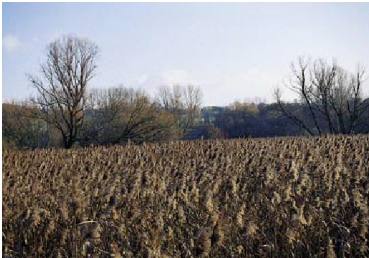
Abb. 7: Die Biotopen der Gefährdungskategorie R sind von Natur aus sehr selten, eine aktuelle Gefährdung besteht jedoch nicht. Von der Großblättrigen Weide ( Salix appendiculata ) aufgebautes Gebüsch hochmontaner bis subalpiner Lagen (Biotoptyp 42.50)

weiterer Fließgewässer sind Kleinröhrichte deutlich zurückgegangen. Eine Gefährdung besteht je doch noch nicht, da es noch zahlreiche Bestände gibt und Kleinröhrichte sich auf geeigneten Standorten rasch wieder entwickeln können. Einige Pflanzengesellschaften des Biotoptyps sind jedoch bereits gefährdet.