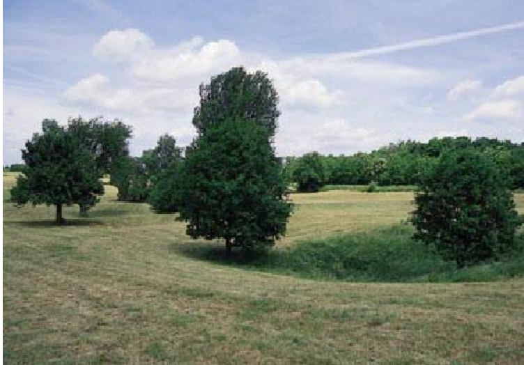
Abb. 4: Dolinen (Biotoptyp 22.20) sind vor allem durch Auffüllung gefährdet (Gefährdungskategorie 3).

Biotoptypen, von denen überwiegend nur noch Bestände vorkommen, deren Qualität aus naturschutzfachlicher Sicht deutlich abgenommen hat. Ihre Bedeutung für Artenschutz, Vielfalt und Eigenart der Landschaft oder für natürliche Prozesse ist eingeschränkt.