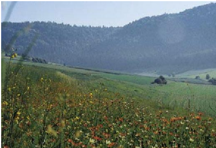
Abb. 5: Der Biotoptyp Acker mit Unkrautvegetation basenreicher Standorte (Biotoptyp 37.12) ist in Baden-Württemberg gefährdet (Gefährdungskategorie 3). Eine für ihn charakteristische Art ist das selten gewordene Sommer-Adonisröschen ( Adonis aestivalis ).