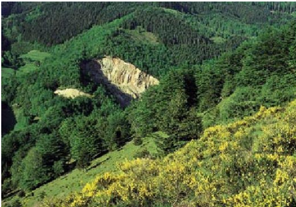
Abb. 1: Die Besenginsterweide (Biotoptyp 36.43) ist in Baden-Württemberg vom Verschwinden bedroht (Gefährdungskategorie 1).

Die folgenden Angaben zu den Gefährdungskategorien enthalten jeweils eine kurze Definition sowie ergänzende Erläuterungen. So weit als möglich orientieren sich die Kategorien an denen