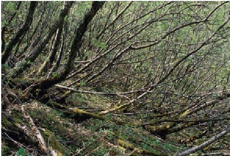
Abb. 8: Nicht gefährdet (Gefährdungskategorie ◐), jedoch für viele Tierarten bedeutsam ist der Biotoptyp Landschilfröhricht (Biotoptyp 34.52)

Relativ gering ist die Gefährdung der Schlehen-Feldhecke (41.23), weil sie gelegentlich auf Brachstreifen entlang von Feldwegen neu entsteht und weniger von einer Nutzung abhängig ist als andere Heckentypen. Ungefährdet ist die Holunder-Feldhecke (41.25), die bei starkem Düngereintrag von angrenzenden Nutzflächen aus anderen Hecken typen entstehen kann.