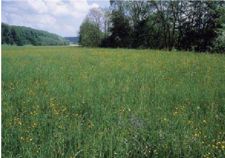
Abb. 6: Die Fettwiesen mittlerer Standorte (Biotoptyp 34.41) ist noch nicht gefährdet, der Biotoptyp steht aber wegen einer merklichen Verschlechterung der Bestandessituation auf der Vorwarnliste (Gefährdungskategorie V).