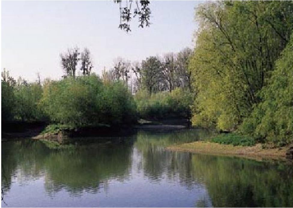
Abb. 2: Altarme (Biotoptyp 13.13) – hier ein Rheinaltarm im NSG Bremengrund – sind in Baden-Württemberg stark gefährdet (Gefährdungskategorie 2).