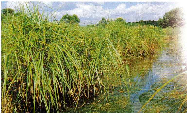
Laubfrosch mit Lebensraum