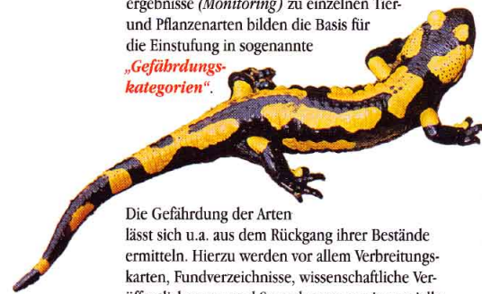
Graues Langohr Arnika

Die Gefährdung der Arten lässt sich u.a. aus dem Rückgang ihrer Bestände ermitteln. Hierzu werden vor allem Verbreitungskarten, Fundverzeichnisse, wissenschaftliche Veröffentlichungen und Sammlungen sowie spezielle Gebietsuntersuchungen herangezogen.